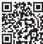
Harmadik féltől származó hangvezérlés